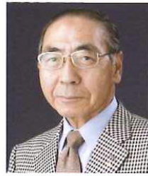
ガバナー 三國 明