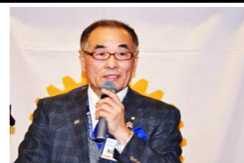
長谷川第10Gガバナー補佐