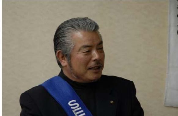
卓話に微笑む 見付幹事