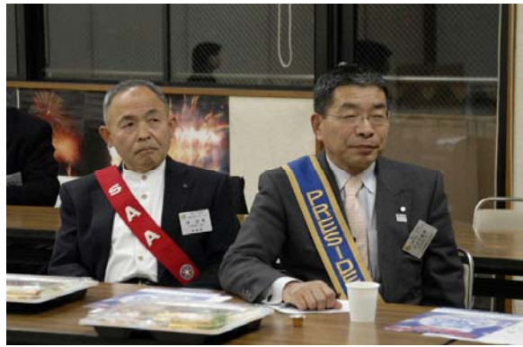
卓話を聞く 沖会員と大井会長