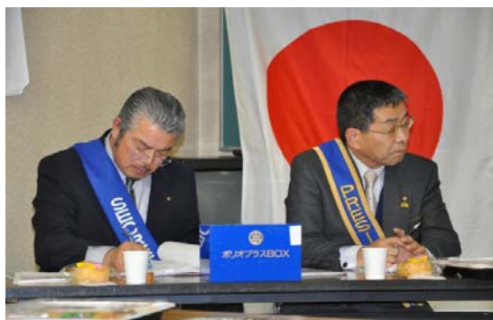
大井会長・見付幹事折り返し地点到達