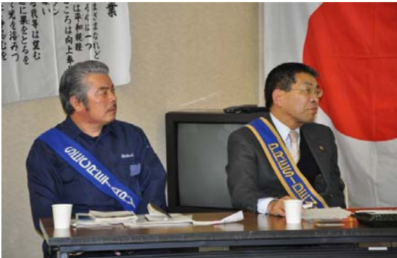
大井会長・見付幹事