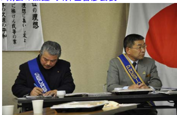
大井会長・見付幹事