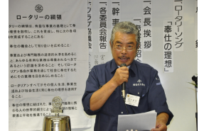
「ロータリーの綱領」の唱和練習