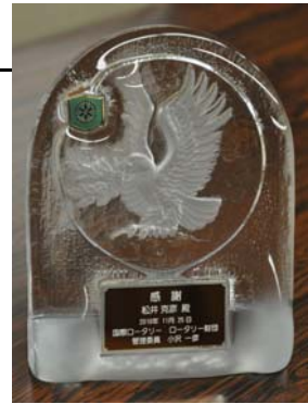
故松井様に送られた表彰牌