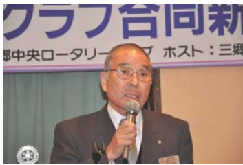
川田商工会長挨拶