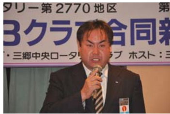
真下青年会議所理事長