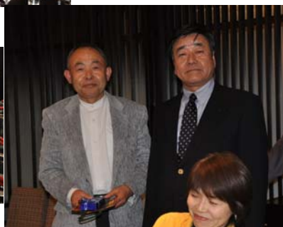
帝国ホテルで誕生大和いを受ける沖会長