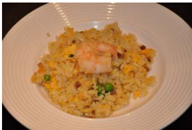
伊藤パストごちそうさまでした。