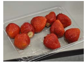
会長からの差し入れ